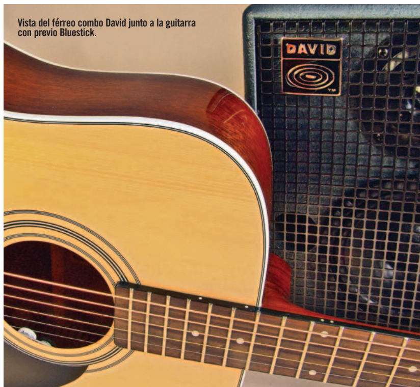
Vista del férreo combo David junto a la guitarra con previo Bluestick.